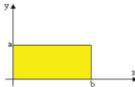
Figura 1. Área tomada de Kouropatov & Dreyfus (2014, p. 2).

Kouropatov & Dreyfus (2014) trabajaron con estudiantes de bachillerato sobre el aprendizaje del concepto de integral definida, basándose en la idea de acumulación. Se mostró evidencia del potencial del enfoque que llevó a los estudiantes a tener un punto de vista sobre el concepto y que los prepara para el teorema fundamental del Cálculo. En este trabajo se implementó un cuestionario con algunas preguntas conceptuales referentes a la integración, por ejemplo, calcular el área del rectángulo que se muestra en la figura 1. Esto con el fin de conseguir información sobre el pensamiento de los estudiantes en situaciones matemáticas elementales basada sobre la idea de acumulación.