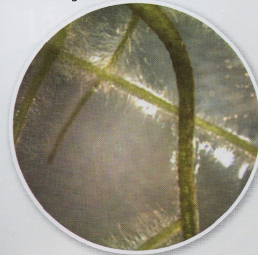
Raíz normal de chile, no transformada.