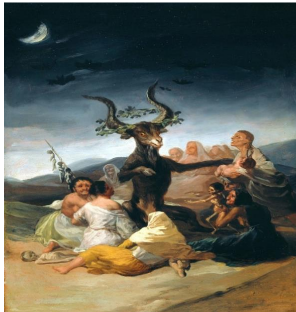
Francisco de Goya, El Aquelarre (1778) Museo Lázaro Galdiano

Resuelta una vez la cuestión en este sentido, Antonio Oliva emprendió la marcha hacia el cerro habitado por el diabólico espíritu, y habiéndose hecho la noche oscura y tétrica, comenzó la ascensión, y no sin trabajo, después de haber vertido copioso sudor y sufrido muchas espinadas y dolorosos araños de selváticas hierbas, encontró la indicada cueva, mansión predilecta de la infernal mula prieta, y con un arrojo digno de mejor empresa, se lanzó sobre el furioso animal, no espantándose de las bocanadas de fuego y de denso humo de azufre que le lanzaba al rostro. 150