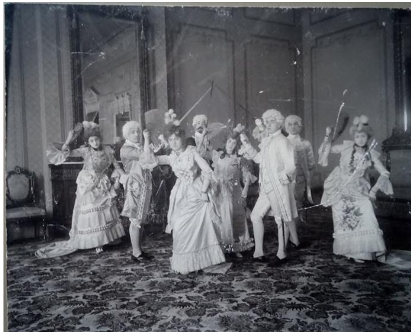
Minué realizado en el Foyer del Teatro Calderón, 1903