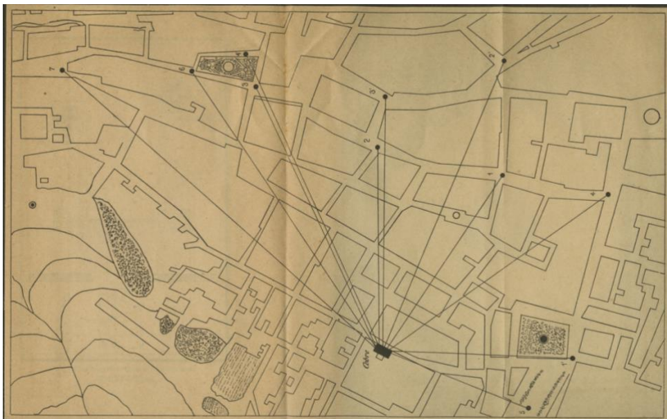
Plano de la distribución de focos eléctricos de 1889. 337

En el siguiente plano se muestra la ubicación estratégica de los faroles que iluminaban con energía eléctrica, mostrando como se pretendía tener un alumbramiento más moderno en las principales calles del primer cuadro de la ciudad en 1889. En dicho plano se especifica como para iluminar dichos puntos se necesitaron distribuir “7 focos alimentados por un dinamo Árame y 4 por uno Weston. Cada foco tiene su circuito completo separado.” Dentro de los espacios a iluminar se pueden distinguir el inicio de la Alameda, seis focos a lo largo de la Avenida Hidalgo, sumado a dos más que rodeaban la plaza principal a un costado de la Catedral, y dos en la calle Tacuba; uno en el vértice que divide a las calles de Arriba y Abajo. Estas ubicaciones responden a una necesidad de ahuyentar la oscuridad de la noche de los callejones más transitados aún después de los tiempos laborales, lo que demuestra una intención de vigilancia en los puntos más importantes de la reducida ciudad de Zacatecas.