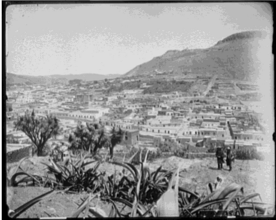
William Henry Jackson, Vista de la ciudad de Zacatecas desde la estación del ferrocarril, ca. 1891, Detroit Publishing Company Photograph Collection