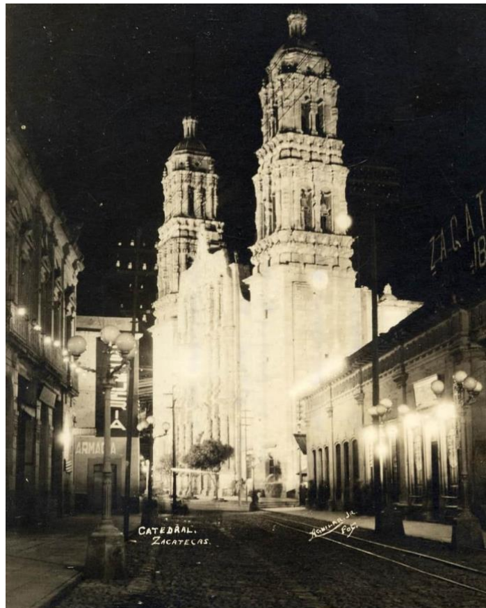
José María Aguilar Jr., “Catedral de Zacatecas iluminada durante la noche en los días del Congreso Eucarístico Nacional.”, 1924, (BCRTA), Colección: Bernardo del Hoyo Calzada.

Finalmente en este trabajo se pretendió demostrar como la ciudad de Zacatecas a lo largo del siglo XIX, las autoridades civiles, eclesiásticas y vecinales tuvieron la disposición constante necesidad de colonizar y vigilar la noche debido a los constantes y desconocidos peligros que habitaban en su oscuridad, siendo el espíritu ilustrado, el movimiento romántico y el determinismo tecnológico algunos promotores de esta colonización y aun así durante ese proceso de desencantamiento, se encontraron registros que pese a la oscuridad, los crímenes, los pobres y los ebrios, hubo acciones recreativas que se fueron modernizando para el “bien” común de la sociedad. Este entrecomillado se debe a que fue más notable estas mejoras nocturnas para ciertos grupos privilegiados – como la que gozaron los vecinos de la moderna avenida Hidalgo –.