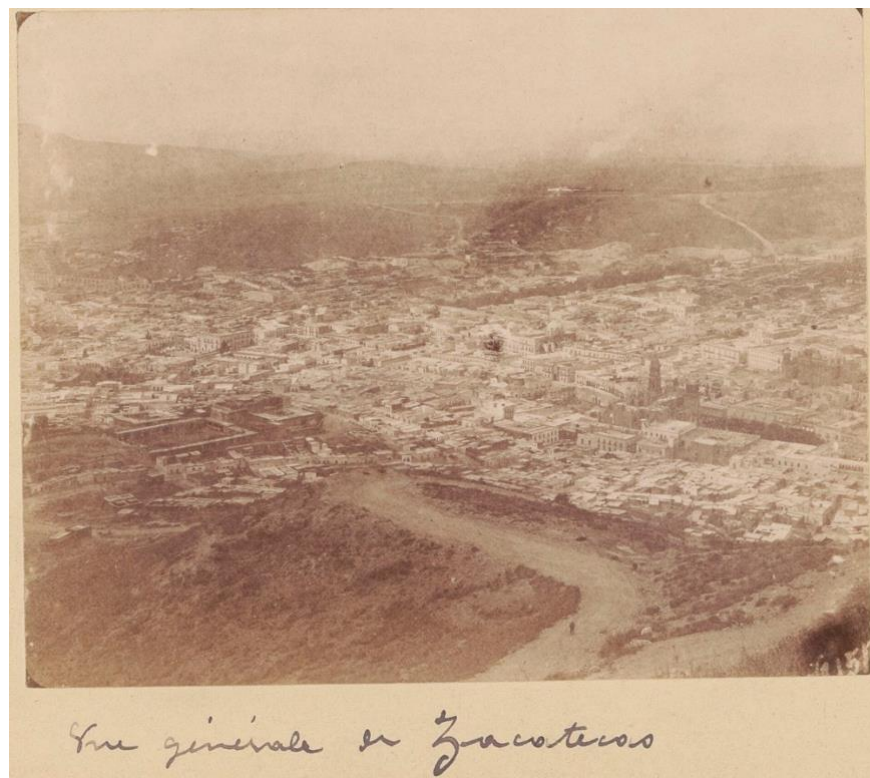
Jules Claire. Vista panorámica de Zacatecas, ca., 1890, Bibliothèque Nationale de France.

Desde su fundación la ciudad de Zacatecas se formó como una villa minera con complejión alargada y con una topografía desorganizada que se basaba en tener como eje central una iglesia, una gran plaza y una calle principal que fungía como un vértice comercial y social. 65 Los asentamientos que se fueron construyendo alrededor del principal eje urbano tuvieron que adaptarse a la irregular topografía de la región, lo que dotó a la ciudad de una cualidad notable de tener callejones reducidos con estructura desordenada.