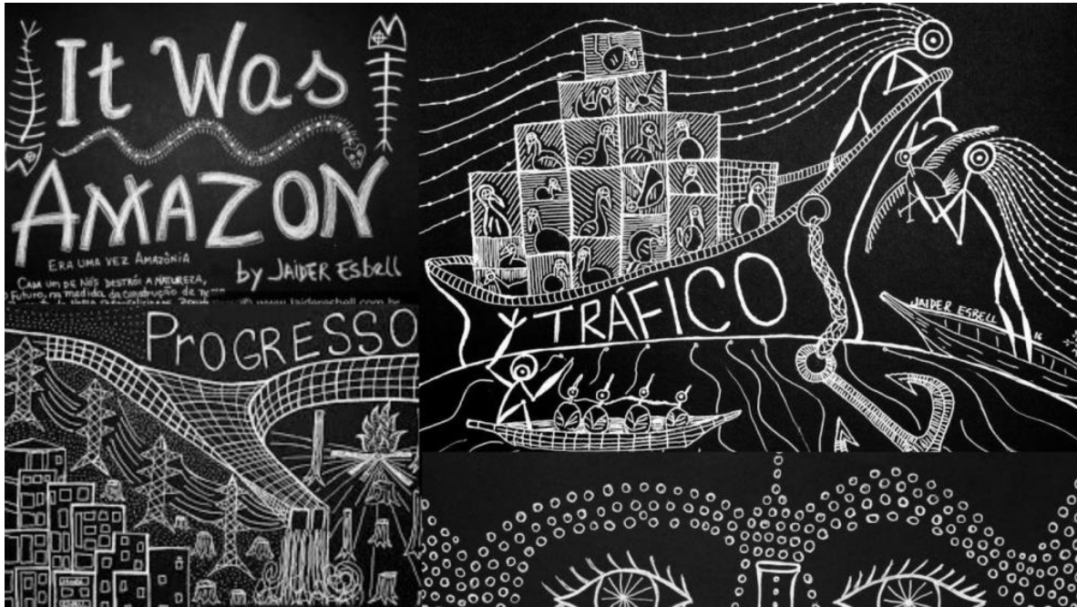
Érase una vez Amazonas -Jaider Esbell

de laboratorio colectivo, donde se piensen y se hagan sistemas comunicantes como pequeños e imperceptibles gestos colectivos de atención a la Tierra, donde estamos llamados a asumir una perspectiva planetaria, capaz de reposicionar los problemas de la comunicación en cuanto a las relaciones con el cosmos. Es un espacio que intersecciona entre la divulgación científica, la (auto)creación cultural y la resistencia política.