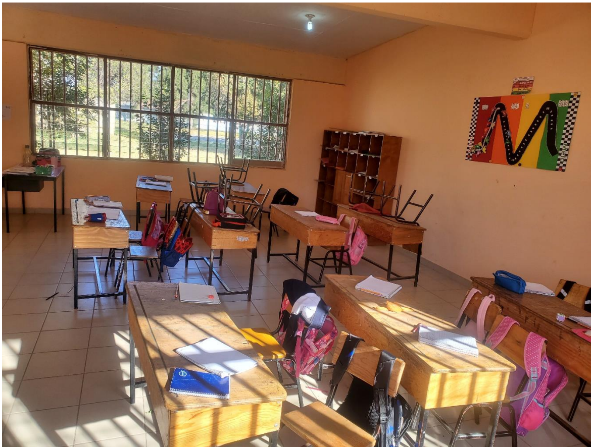
Ilustración 1: Fotografía del aula regular de clases escuela "México"

Sobre la infraestructura de esta institución cuenta con un aula para la dirección, un espacio que funge como cocina-comedor, una bodega para materiales de educación física, 10 aulas regulares donde los docentes titulares de cada grado imparten clases, baños para niñas y niños, dos canchas de basquetbol, plaza cívica donde se realizan honores a la bandera, espacios de área verde y una pequeña bodega llamada auditorio donde la maestra de USAER trabaja con los alumnos y alumnas fuera del aula regular.