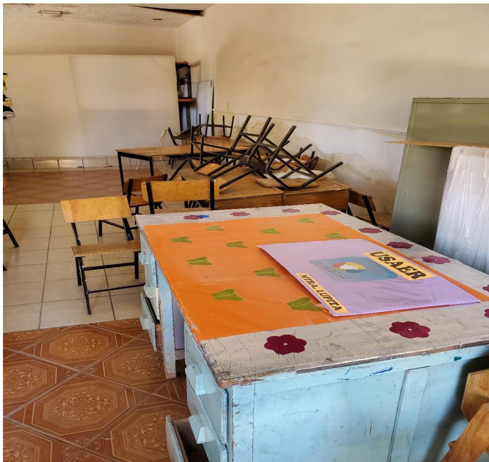
Ilustración 3: Fotografía de la bodega- auditorio ahora salón de la maestra de USAER