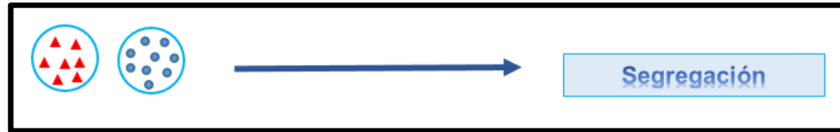
Figura 2. Segregación educativa

FUENTE: (Elaboración propia a partir de (Parrilla, 2002).