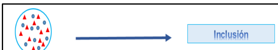
Figura 4. Inclusión educativa