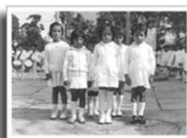
Actividades en un Jardín de Niños de la década de los ochenta, AHSEP, 1980.