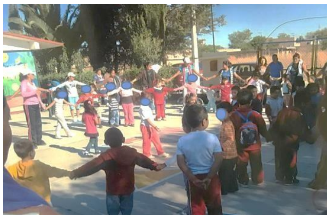
Imagen 7. Actividades en patio cívico del jardín

El jardín ha cambiado considerablemente lo que ha dado una mejor calidad en el desempeño de actividades culturales en las que interactúan los niños y las niñas (ver imagen 10). Con la investigación se pudo rescatar algunos elementos importantes como lo son las siguientes imágenes correspondientes al ciclo escolar 2012-2103, se puede apreciar el trabajo de las educadoras y su motivación para realizar las actividades (ver imagen 7 y 8).