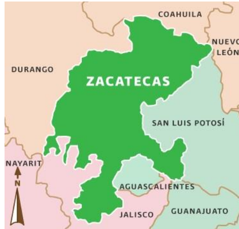
Imagen 2. Ubicación geográfica del estado de Zacatecas