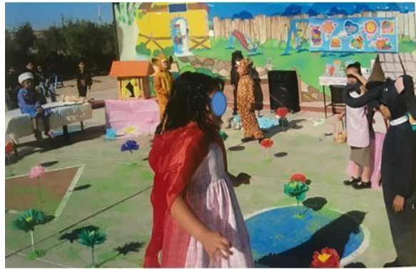
Imagen 8. Presentación de cuento “Caperucita Roja” en patio cívico ciclo escolar 2012-2013