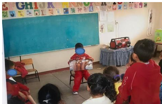
Imagen 6. Lectura de cuentos en salón de clase

Con su incorporación al PETC el jardín de niños ha sumado grandes beneficios en sus instalaciones e infraestructura, se ha dotado de materiales didácticos, dentro de los salones de clase se cuenta con televisor y computadora, se tiene un equipo de sonido para los eventos cívicos y sociales y un proyector (ver imagen 6).