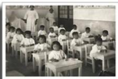
Kindergarten de la Fabrica Nacional de Vestuario y Equipo, Fideicomiso Archivos Plutarco Elias Calles y Fernando Torreblanca