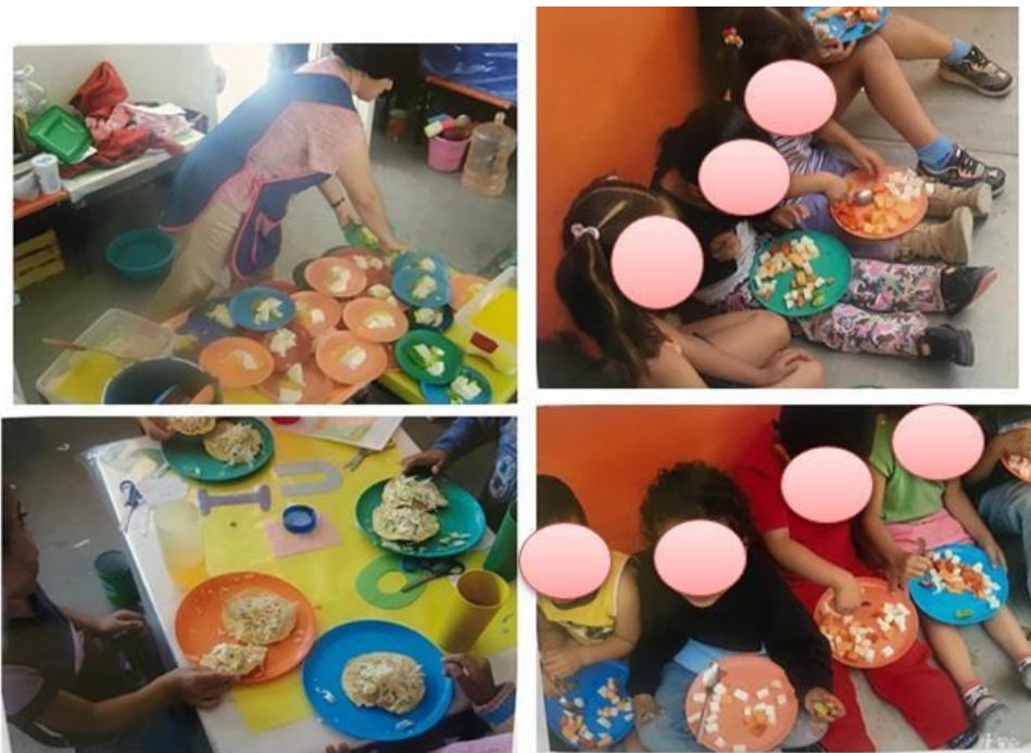
Imagen 4. Collage de la entrega de platillos de los alimentos en el desayuno

compras semanales. En las siguientes imágenes se aprecia la organización que las docentes plantean para entregar el desayuno al alumnado, se proporciona en el salón de clases de cada grupo, si por alguna razón se tienen actividades en el patio cívico se les permite tomar el desayuno en un espacio adecuado (ver imagen 4).