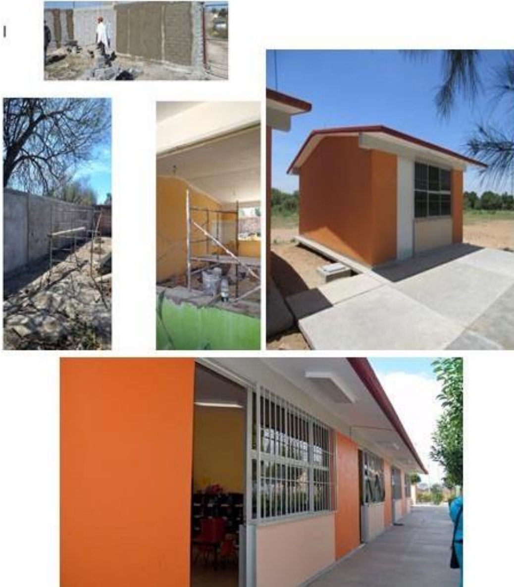
Imagen 11. Construcción y rehabilitación jardín de niños “Rosaura Zapata”