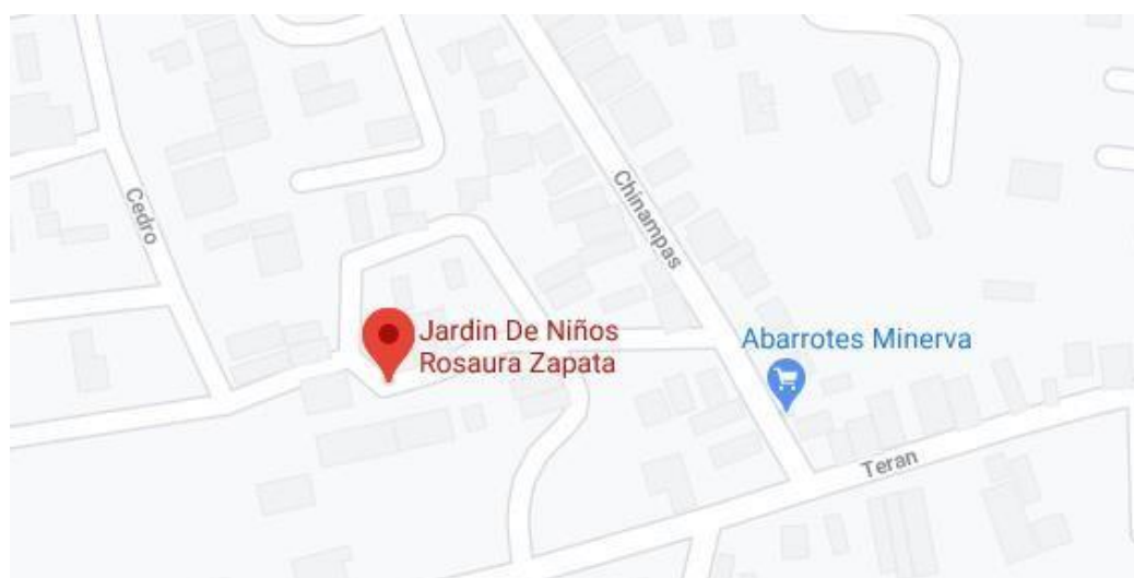
Imagen 3. Ubicación jardín de niños

Al jardín acuden niños y niñas de colonias aledañas, sobresaliendo la colonia Lázaro Cárdenas, ahí se concentra un alto índice de menores en condiciones de pobreza extrema y marginación. En la siguiente figura se muestra la ubicación del jardín, pudiendo apreciar las calles aledañas señaladas anteriormente (ver imagen 3).