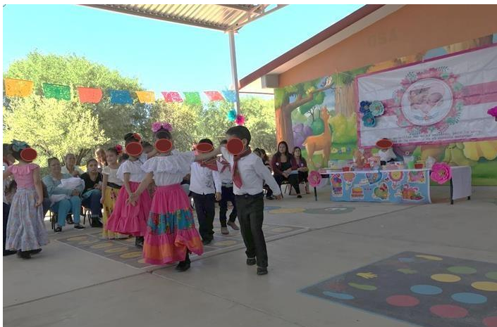
Imagen 10. Festival del día de las madres

El jardín de niños “Rosaura Zapata” se incorpora al PETC en el ciclo escolar 2013-2014, las autoridades directivas en turno iniciaron una serie de gestiones que se han visto reflejadas por varios ciclos escolares, actualmente se cuenta con un domo que ha dejado satisfacción a la comunidad educativa, donde se llevan a cabo actividades sociales y culturales. En las siguientes imágenes se puede apreciar las aportaciones de trabajo y gestión que se le han hecho a la escuela, el actual director de la institución ha dado seguimiento a las gestiones y trabajos de infraestructura, con la construcción de aulas, la barda perimetral y una rehabilitación en ventanas puertas y pintura en todas las aulas de la escuela.