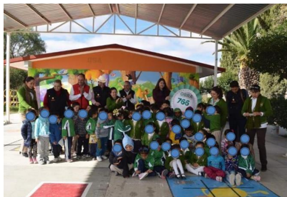
Imagen 9. Visita de autoridades municipales en patio cívico

Algo que se ha fortalecido con los diferentes acuerdos presentados por el gobierno federal, en coordinación con las entidades federativas, ha sido la infraestructura de las escuelas para contar con espacios adecuados y didácticos que faciliten la formación integral, especialmente las escuelas que participan en el PETC. El liderazgo académico de las autoridades directivas juega un papel muy importante, pues con ello, los maestros y maestras de una escuela asumen la posibilidad de trabajar de manera colectiva en sus actividades, y con ello tener mejores resultados en la comunidad escolar, muchas ocasiones en condiciones adversas.