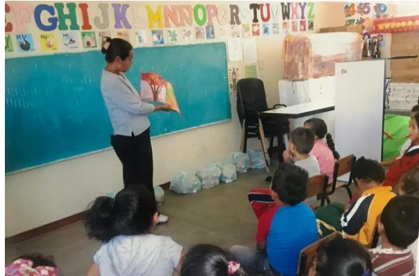
Imagen 5. Bolsas de despensas y desayunos escolares para cada niño y niña

les facilitan a los padres y madres de familia por una cuota mínima, se destina una bolsa para cada niño una vez por semana (ver imagen 5).