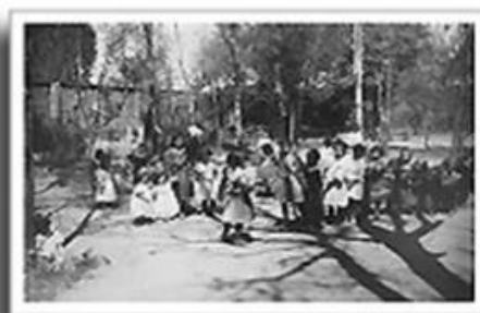
Niñas Jugando a San Miguelito, Archivo Federico Casasola