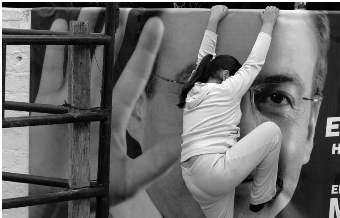
Michoacán, México. Una niña juega ante una manta de la campaña de Felipe Calderón Hinojosa, candidato del PAN a la presidencia, durante el evento de campaña, 11 de febrero de 2006.