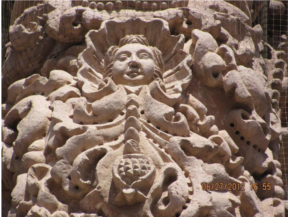
Figura 8. Cardo mariano portada principal de la Catedral.