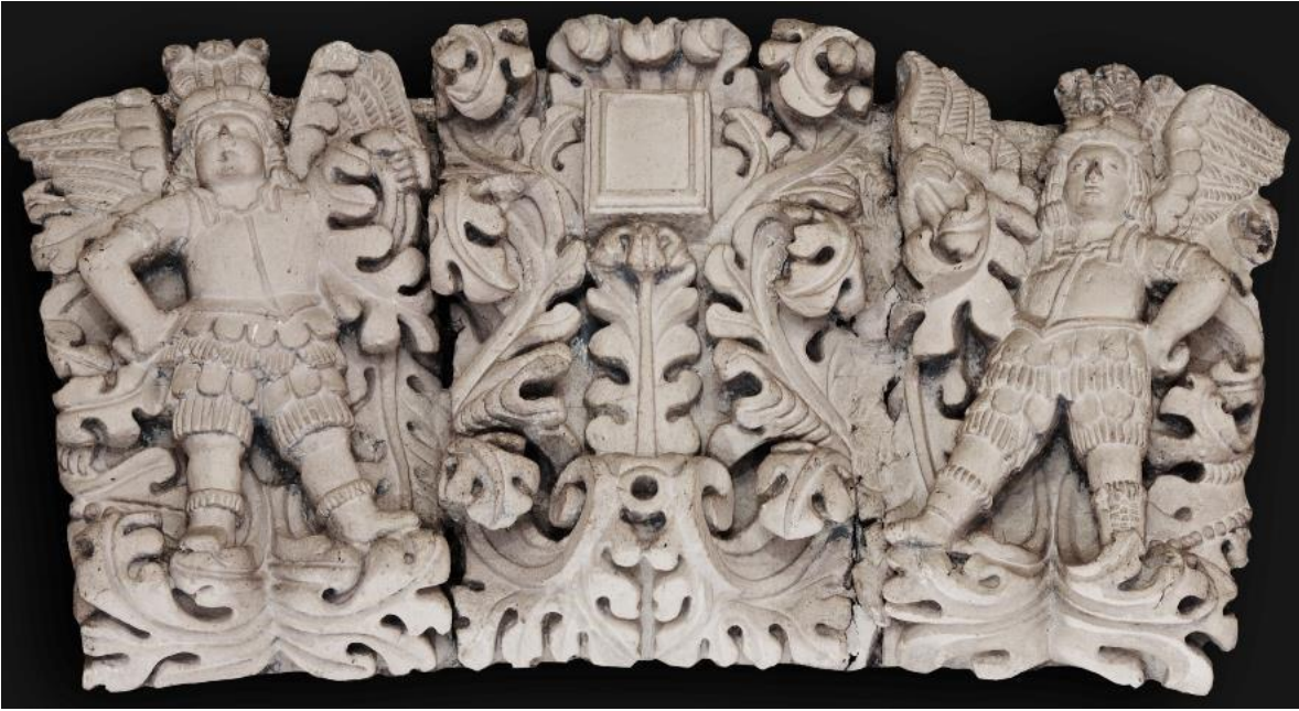
Figura 11. Espejo de justicia.