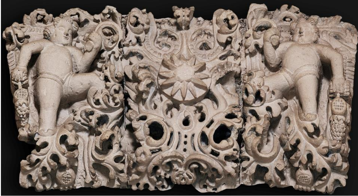
Figura 4. Estrella matutina.