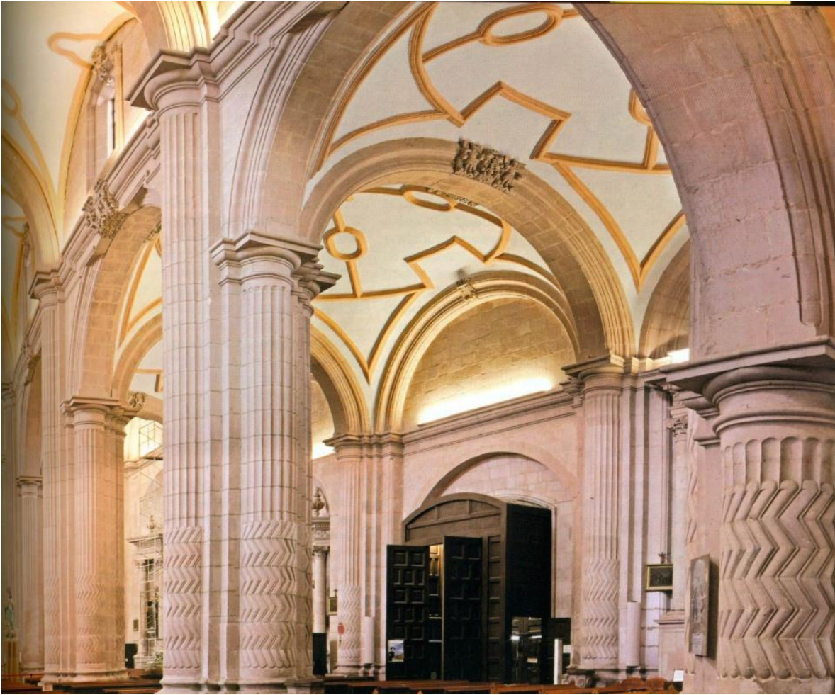
Figura 2. Panorámica de las claves [i]