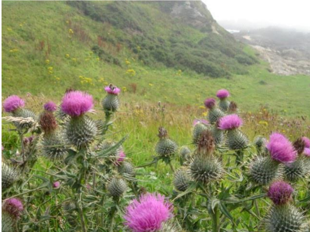
Figura 6. Cardo mariano bajado de internet.