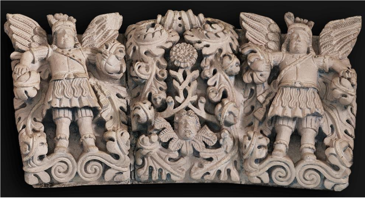
Figura 9. Rosa mística.