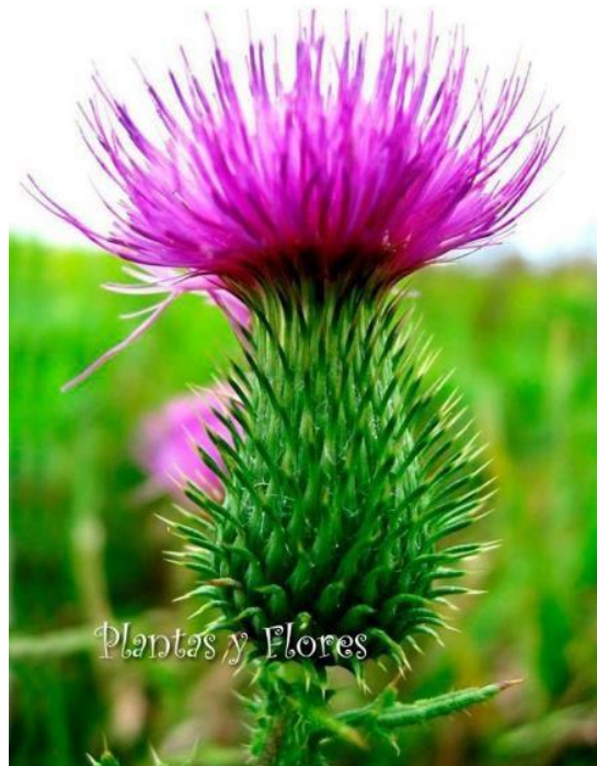
Figura 5. Cardo mariano bajado de internet.