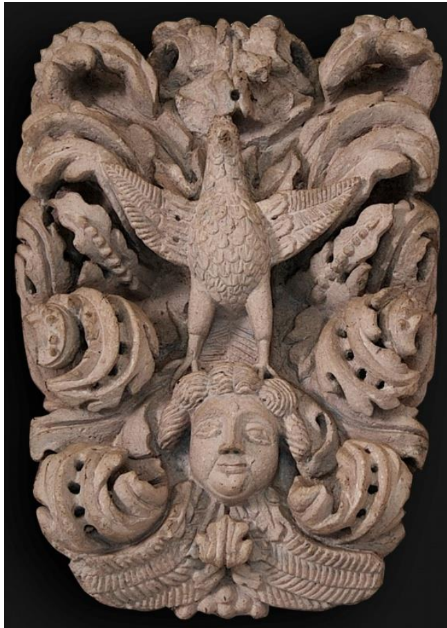
Figura 3. La paloma.

nos ocupa, la paloma en medio de un eje vertical, está con las alas extendidas y parada sobre la cabecita de un querubín; se desprendió una parte del pico. El querubín es de facciones toscas, de bucles ensortijados alrededor de la frente; sus alas son ilógicas, están saliendo a la altura de la barbilla. El exquisito tallado de la paloma y del acanto es de un artesano diferente al del querubín. Todo rodeado de follaje de acanto con hilos de perlas, algunas partes con excavado profundo; la talla de la paloma, así como la ornamentación vegetal, es exquisita; contrasta con la tosca cara del querubín. Hay ligeros restos de pintura color gris.