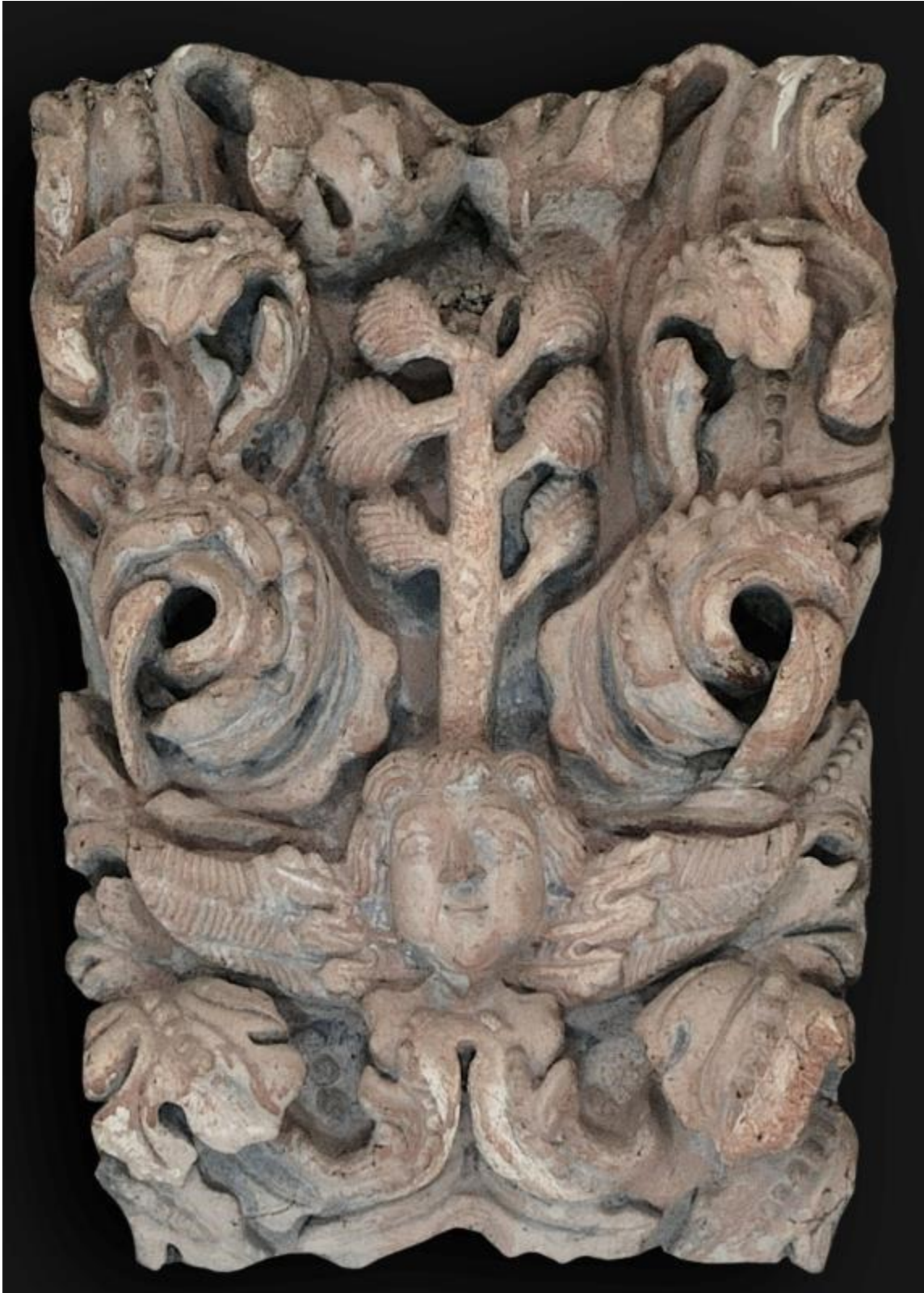
Figura 10. Árbol de Jessé o Cedro del Líbano.