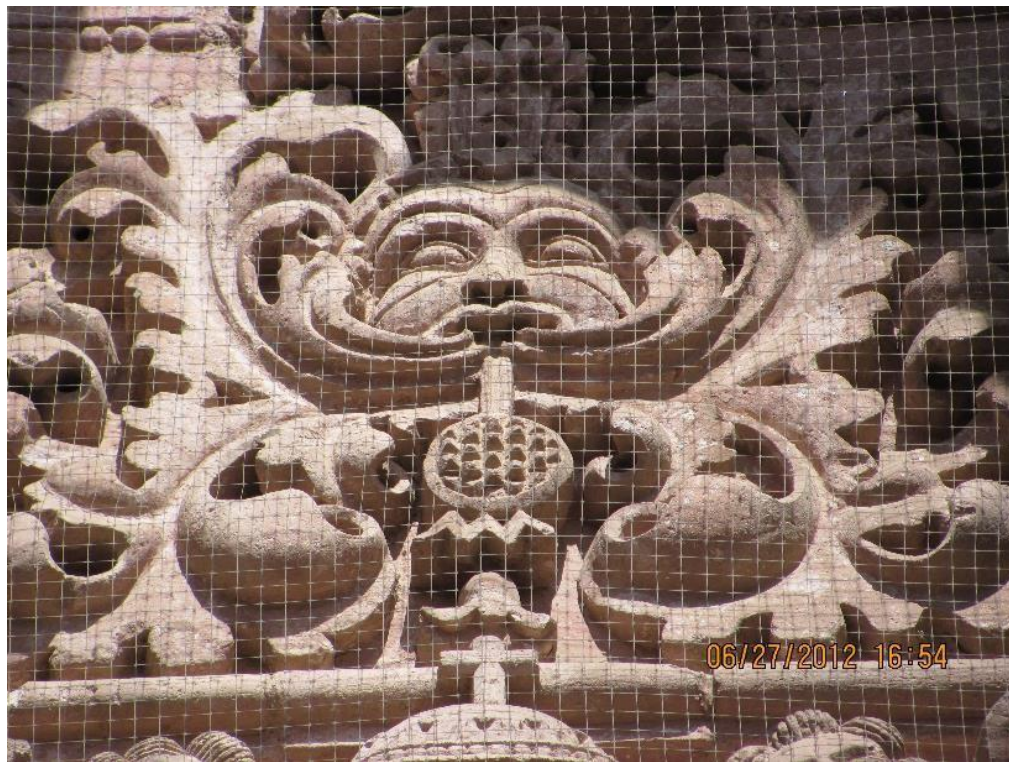
Figura 7. Cardo mariano, portada principal de la Catedral.