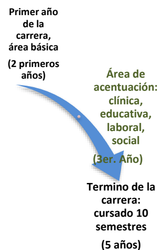
Figura 1 Esquema de evaluación de trayectoria escolar a los estudiantes de la carrera de psicología de la UAZ

En la figura 1. Se muestra un esquema para ejemplificar lo anteriormente dicho.