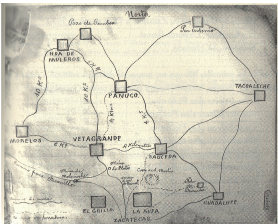
FIGURA 3. PLANO DEL PROYECTO DE DEFENSA DEL LADO NORTE DE LA CIUDAD DE ZACATECAS