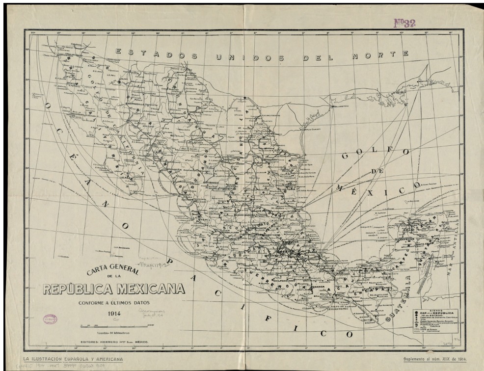
FIGURA 2. CARTA GENERAL DE LA REPÚBLICA MEXICANA CON LOS ÚLTIMOS DATOS 1914

47 x 65 cm, escala 1: 5,000,000, identificador 06_01_011775.