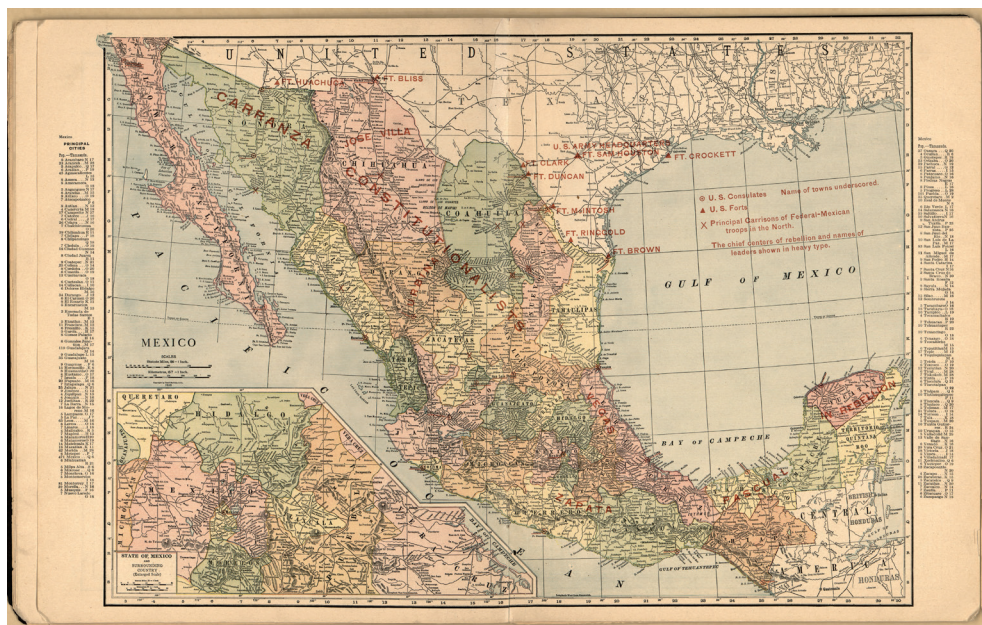
FIGURA 1. MAPA DEL CONFLICTO DE LA REVOLUCIÓN MEXICANA