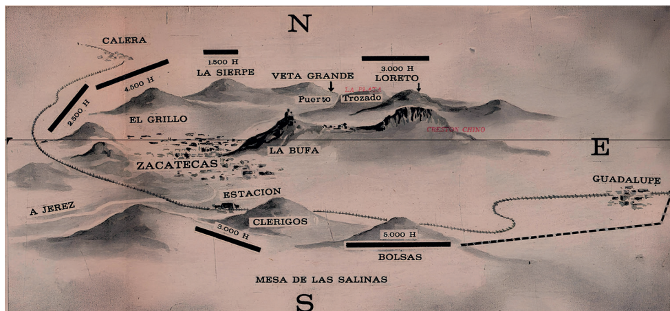
FIGURA 5. PLANO DE LA BATALLA DE ZACATECAS