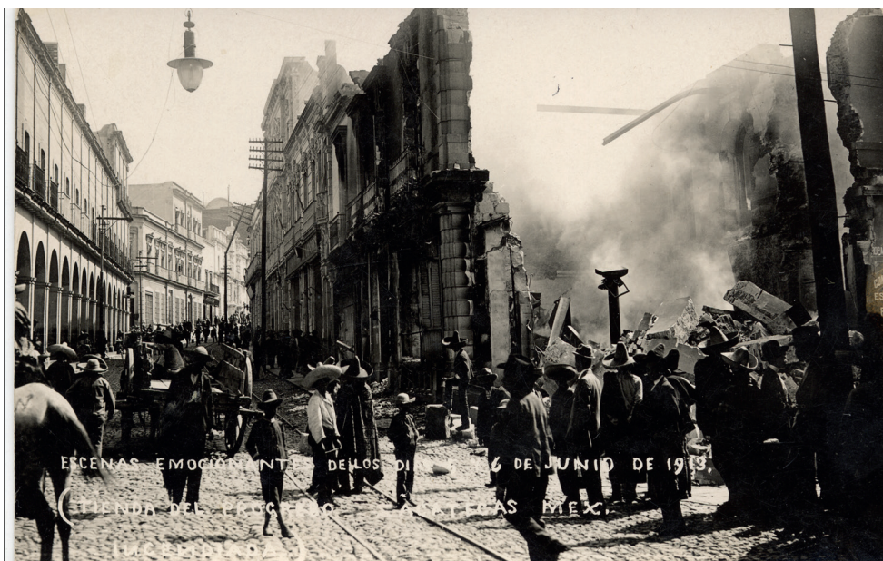
FIGURA 7. FOTOGRAFÍA TOMADA EL 6 DE JUNIO DE 1913, CON LA IMAGEN AL FONDO DEL PALACIO FEDERAL DINAMITADO EL 23 DE JUNIO DE 1914.