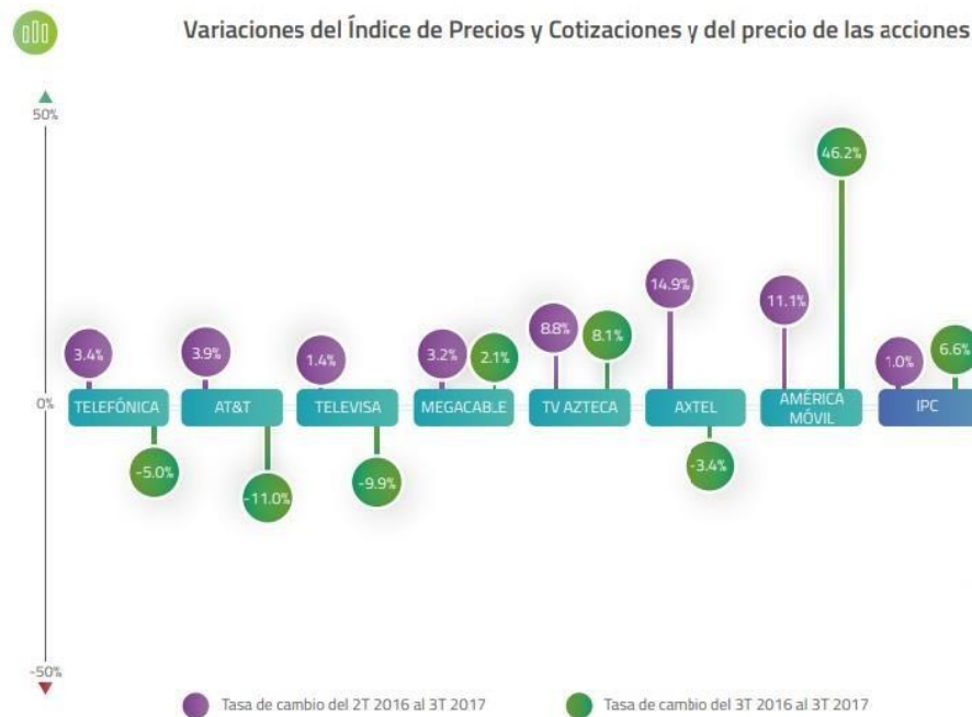
Figura 1.4.4.2 Variaciones de precios y cotizaciones y del precio de acciones

Cabe señalar que este informe únicamente contempla las empresas dedicadas a prestar servicios utilizando la telecomunicación y radio comunicación. Por lo que sólo se muestra las grandes compañías de televisión Tv Azteca y Televisa.