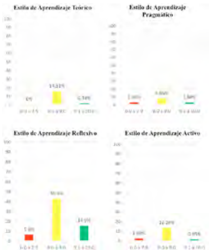
Figura 1. Porcentaje de alumnos por nivel de aptitud en la variable estilos de aprendizaje por rangos de calificaciones.

Se presentan un conjunto de gráficos en los que se representa el porcentaje de alumnos por niveles de aptitud en la variable estilos de aprendizaje y su rango de calificaciones. Este instrumento evalúa cuatro estilos entre los que se encuentran: activo, reflexivo, pragmático y teórico. En la Figura 1 se muestran los porcentajes de alumnos por nivel de aptitud en la variable de estilos de aprendizaje, por rango de calificaciones.